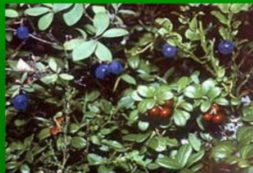
черника и брусника