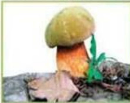
белый гриб (дубовый)