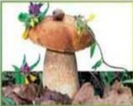
белый гриб (еловый)